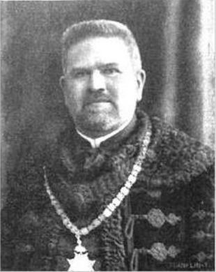
Beke Manó (1862-1946)